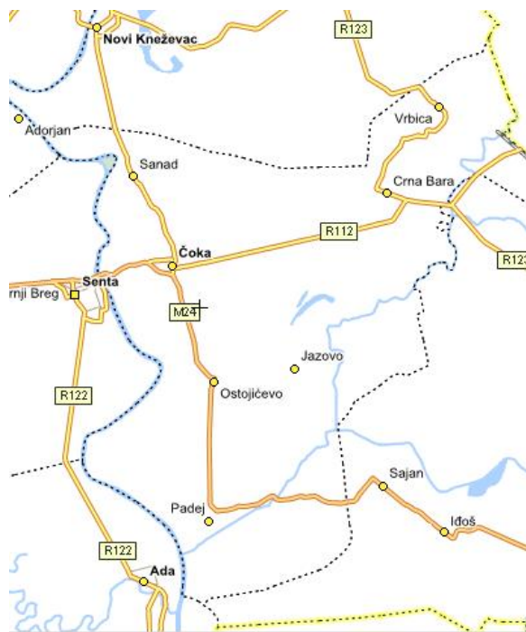
Карта 2. Положај насеља у Општини Чока

Чока као највеће насеље представља центар општине. Територија општине има површину од 321 км 2 . (карта бр.2)