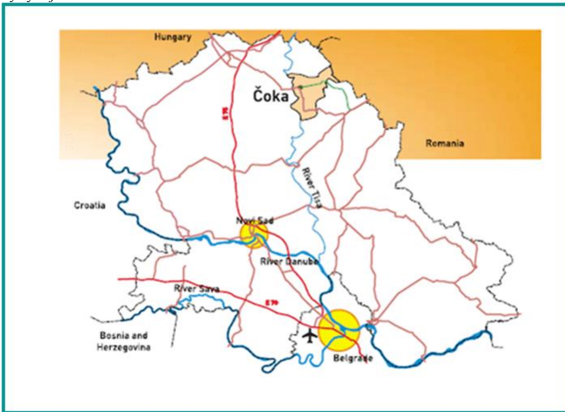
Карта 1. Положај Општине Чока у региону

Налази се 180 км северно од Београда и 100 км од Новог Сада, 170 км западно од Темишвара и 60 км јужно од Сегедина. Територија чоканске општине граничи се са територијама четири општине са Новим Кнежевцом на северу, са Кикиндом на истоку, Сентом и Адом на западу. На истоку једним делом избија на државну границу према Румунији.